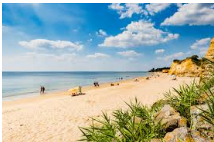
plage la source, haut pénestin

Belle-Ile-en-Mer, embarquement via Quiberon