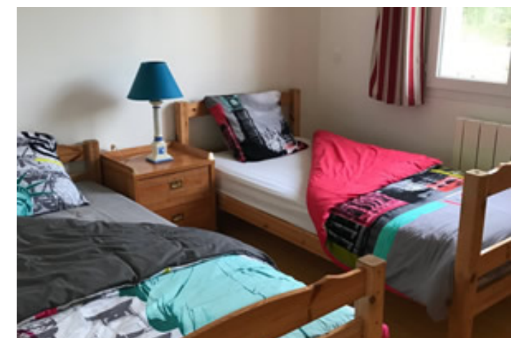
chambre enfant lits simple