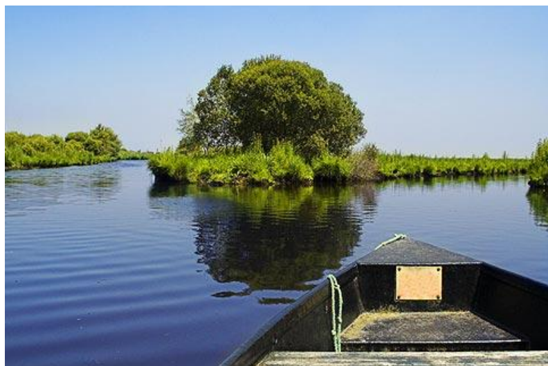
Parc de la Brière

https://www.labaule-guerande.com/activites-a-voir-a-faire-penestin-camoel-ferel.html