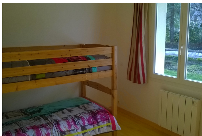
version lits superposés

Deux possibilités d'aménager la chambre enfant selon votre choix.