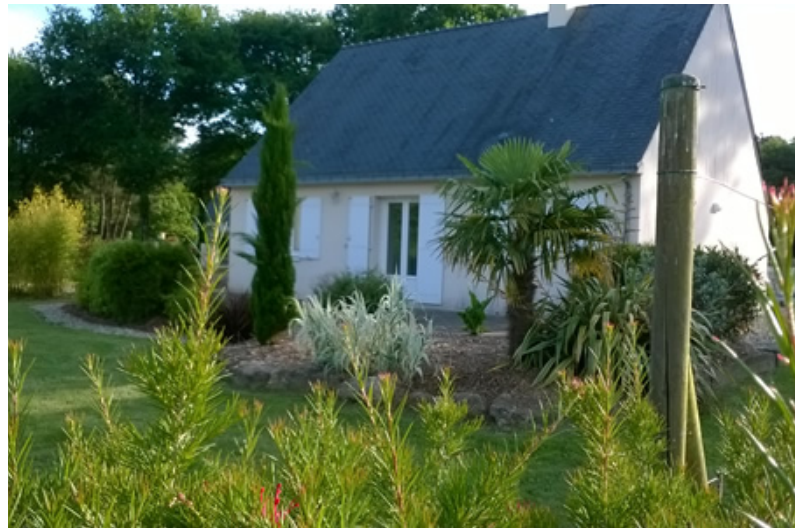
Commune de Camoël 56 130, location saisonnière