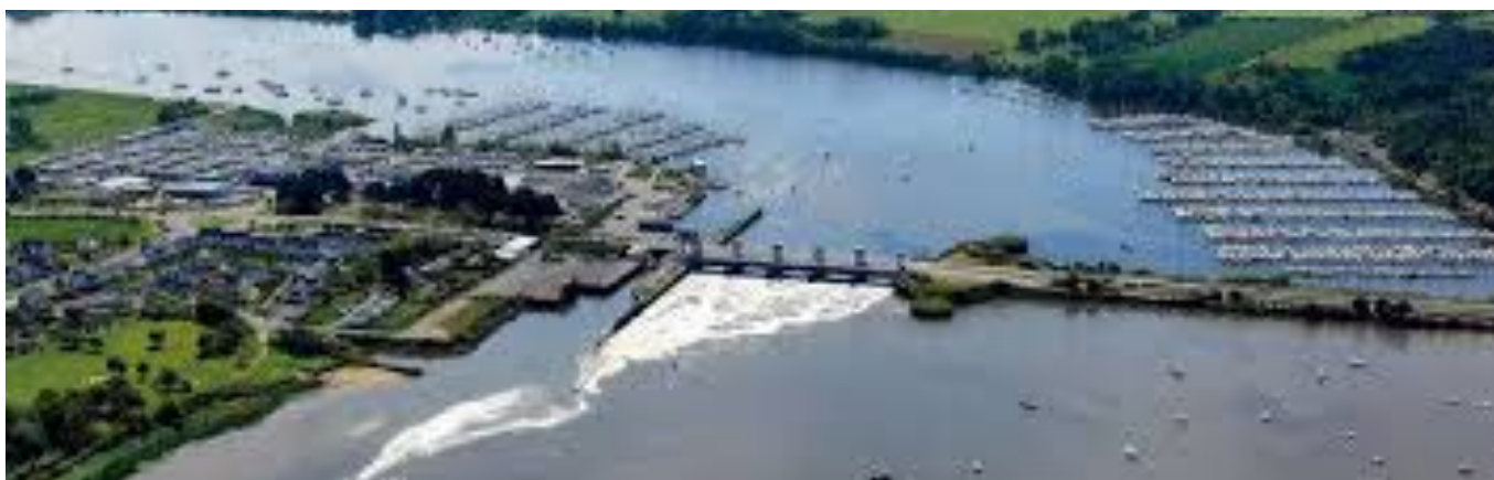
Barrage d'arzal, ports de plaisance rive Camöel et Arzal