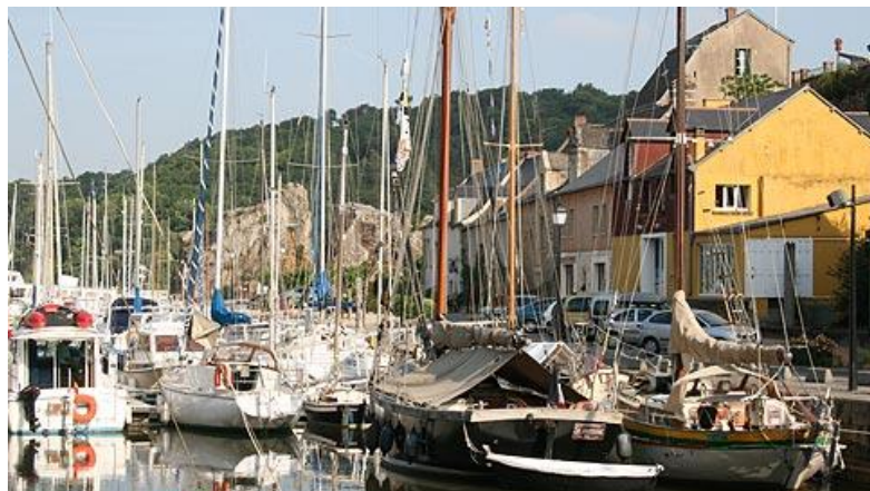
port de la Roche Bernard