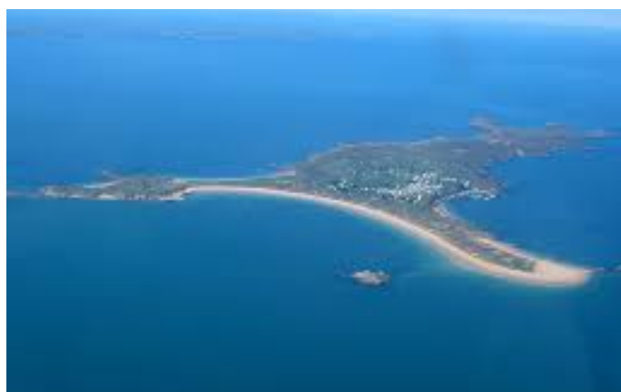
île de houat