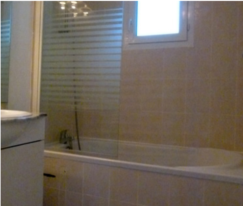
Salle de Bain , baignoire - douche